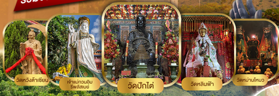
วัดหวังต้าเซียน เจ้าแม่กวนอิม ธิลิสขัย วัดปึกไต่ วัดหลินฟ้า วัดหน้ามโนะ

รวมขึ้นกระเช้าองปิง 360 ชั่วโมงฟรีวัน FREEDAY