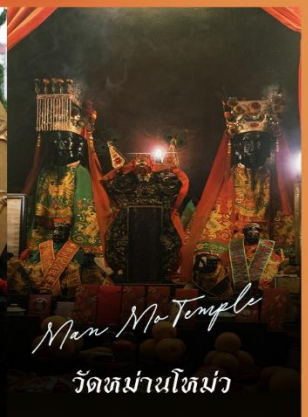
Man Mo Temple วัดหม่ามใหม่