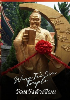
Wong Tai Sin Temple วัดหวังต้าเซียน