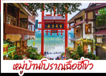
หมู่บ้านโบราณฉือซีโจว