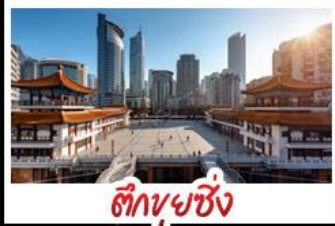
ตึกขุยซิง

พระแกะสลักหินต้าจู้ - หลุมฟ้าสะพานสวรรค์ - เจานางฟ้า ตึกขุยซิง - ตึกตะเกียบ - หมู่บ้านโบราณฉือซีโจว