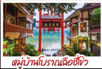
หมู่บ้านโบราณฉือซีโจว