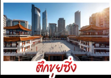
ตึกชุยซิง

พระแกะสลักหินต้าจู้ - หลุมฟ้าสะพานสวรรค์ - เวนางฟ้า ตึกชุยซิง - ตึกตะเกียบ - หมู่บ้านโบราณฉือซีโจว