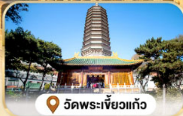
วัดพระเจี๋ยวกั๋ว