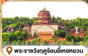
พระราชวังฤดูร้อนอี่เหอหยวน