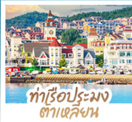
ทำเรือประมง ต้าเหลียน