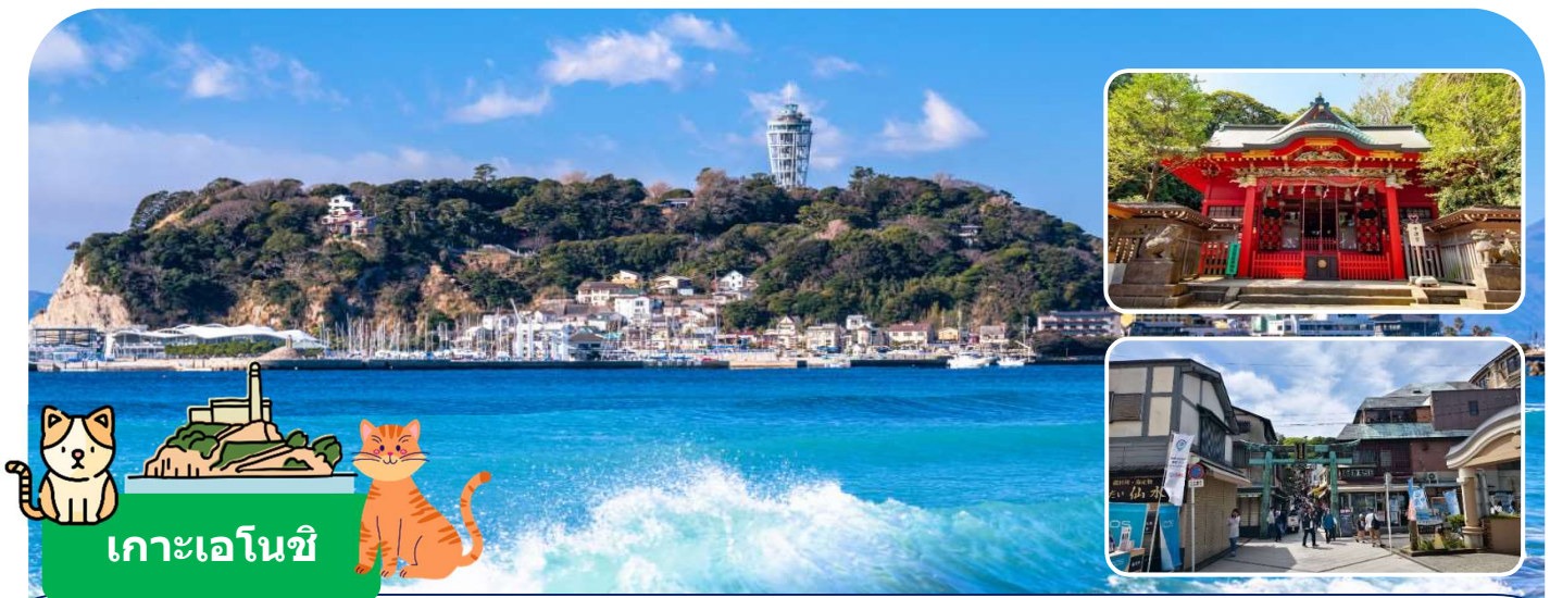
เกาะเอโนชิ

นำท่านเดินทางสู่เมืองคามาคุระ จังหวัดคางาวะ เมืองประวัติศาสตร์ที่ขึ้นชื่อเรื่องวัดวาอาราม และวิวทะเลสุดโรแมนติก ให้ท่านได้สัมผัสกลิ่นอายญี่ปุ่นแบบดั้งเดิมผสมผสานกับความสงบของธรรมชาติ