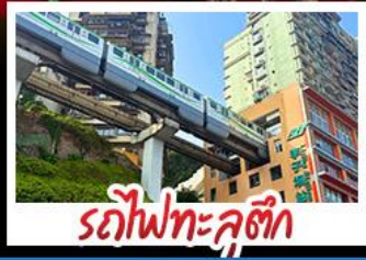
รถไฟทะลุคัง