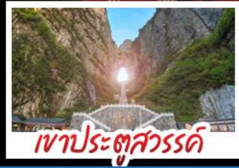
เขาประตูลั่วจื่อ