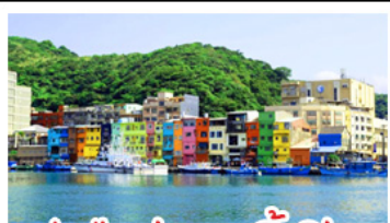
ทำเรือประมงเจิ้งปิ่น

รถไฟสายโบราณอาลีซาน - ตึกไทเป 101 ประมงเจิ้งปิ่น - จิวเฟิน - ล่องเรือทะเลสาบสุริยัมจินตรา ทานเมมูเค็ด เสี่ยวหลงเปา & ปลาประจานาธิบดี ซ้อป๋ิง 3 ย่านดัง : ซิเหมินตง - ไทจงไนท์มาร์เก็ต - MITSUI OUTLET