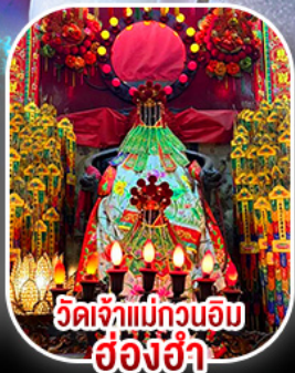
วัดเจ้แม่กวนอิม อ้งอ้