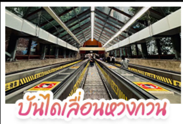
บันไดเลื่อนแขวงทวน