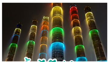
น้ำพุไม้ไผ่ตักSKP