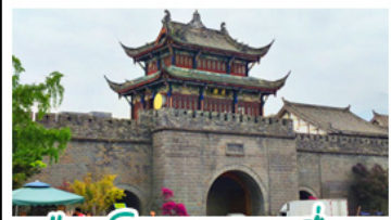
เมืองโบราณกวนเซี่ยน

ภูเขาสี่ฤดู - อุทยานน้ำผิงโกว - สะพานหนานเฉียว ร้านหนังสือจงซูเก้อ - เมืองโบราณกวนเสียน จตุรัสหย่างเทียนหู่ - หมีแพนด้าเซลฟี่ ถนนโบราณชอยกวางชอยแคบ - ถนนคนเดินไท่กู่หลี่ ถนนคนเดินซุนซี - ถนนโบราณจินหลี่ แพนด้ายักษ์ป็นตัก - น้ำพุไม้ไผ่ตักSKP - วัดต้าอ้อ