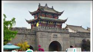
เมืองโบราณทวนเซี่ยน

ภูเขาสี่ดรุณี - อุทยานปู้ผิงโกว - สะพานหมานเฉียว - ร้านหนังสือจงซูเก๋อ - เมืองโบราณกวนเสี้ยน จตุรัสหยางเกียนหวู่ - หมีแพนด้าเซสพี - ถนนโบราณชอยกวางชอยแคบ - ถนนคนเดินไท่กู๋หลี่ ถนนคนเดินซุนซี - ถนนโบราณจินหลี่ - แพนด้ายักษ์ปิ่นตึก - น้ำพุไม้ไผ่ตึกSKP - วัดต้าอ้อ