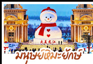
มนุษย์หิมะยักษ์