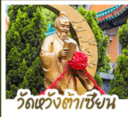
วัดเข่งต้าเซียม