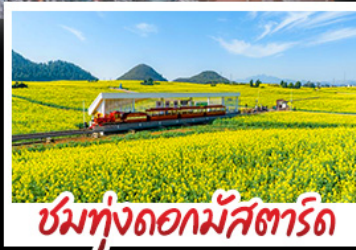
ชมทุ่งดอกมัสตาร์ด