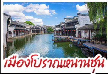
เมืองโบราณหนานชุน

DISNEYLAND SHANGHAI เต็มวัน เมืองโบราณหนานชุน (รวมล่องเรือ) - วัดจิ่งอัน เมืองโบราณหนานชุน - ตลาดร้อยปีฉิงเซี่ยงเมี่ยว มือพิเศษ บุฟเฟ่ต์ BBQ, เสี่ยวหลงเปา