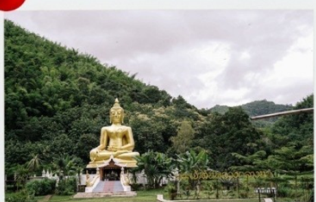
วัดนาคูหา