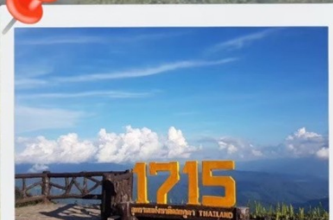
จุดชมวิวที่มีความสูง 1715