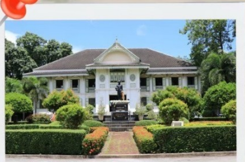
คู่มือเจ้าหลวงเมืองแพร์