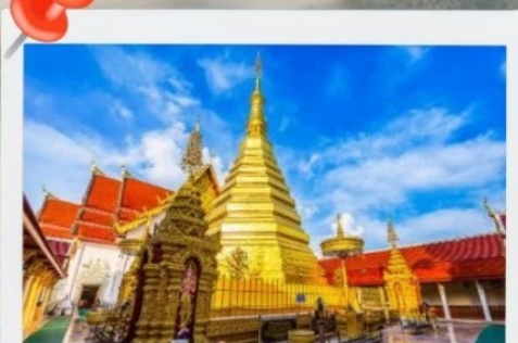
วัดพระธาตุช่อแฮ