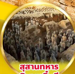
สุสานทหารดินเผาจีนซี