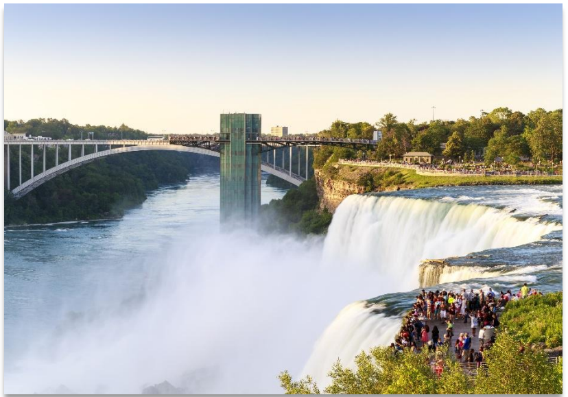
NIAGARA FALLS OBSERVATION AREA

เกิดจากกระแสน้ำมหาศาลที่ไหลมาจาก ทะเลสาบทั้งห้า (Great Lakes) ก่อนจะไหลลงสู่แม่น้ำไนแอกการ่า ซึ่งกั้นพรมแดนระหว่างประเทศ สหรัฐอเมริกา และ แคนาดา สร้างภาพความงดงามและยิ่งใหญ่ของธรรมชาติที่ไม่มีที่ใดเหมือน นำท่านเดินเข้าสู่ “จุดชมวิวน้ำตกไนแอกการ่า” (Niagara Falls Observation Area) เพื่อชื่นชมทัศนียภาพของน้ำตกที่โอบล้อมด้วยหมอกละอองน้ำและสายรุ้งหลากสี พร้อมเก็บภาพความประทับใจอันงดงามได้อย่างเต็มที่