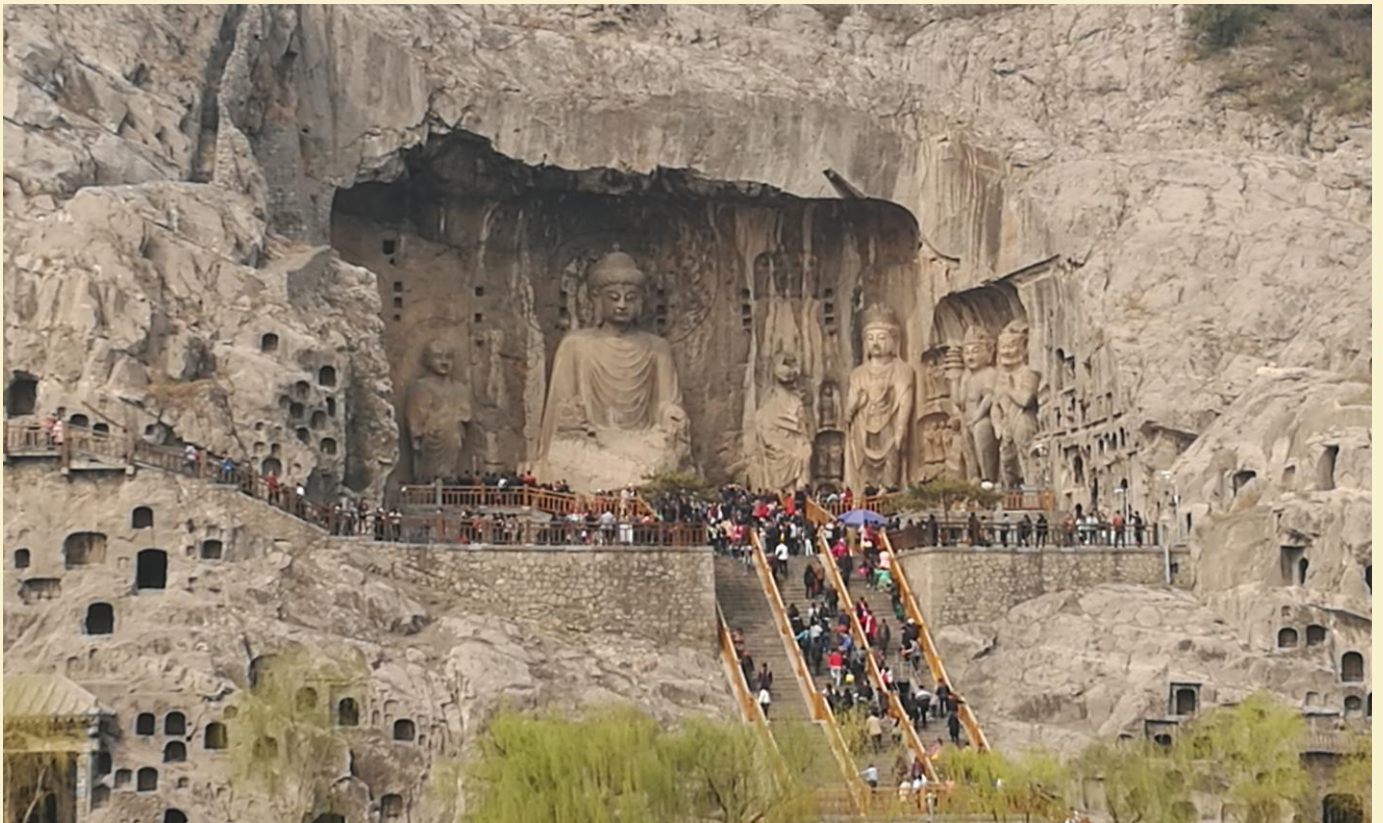
มีพระประธานสูง 17 เมตรสลักอยู่กลางถ้ำรายล้อมด้วยพระโพธิสัตว์และทวยเทพ

บาล รวมถึงการเขียนภาพจิตรกรรมลงบนผนังถ้ำ .....ปัจจุบันยูเนสโกประกาศให้หลงเหมินเป็นมรดกโลกทางวัฒนธรรมในปี ค.ศ. 2000 นำท่านชมถ้ำเฟิงเซียนชื่อ ซึ่งเป็นจุดไฮไลต์ ภายในถ้ำถ้ำ