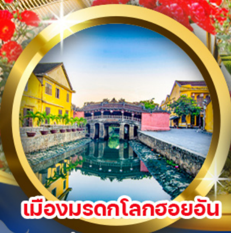
เมืองมรดกโลกฮอยอัน