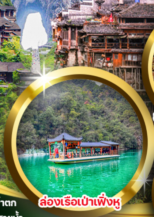
ล่องเรือเป่าเฟิ่งหู