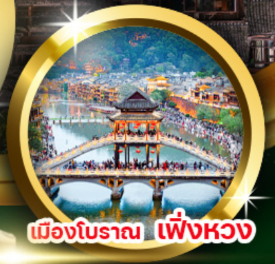
เมืองโบราณ เฟิ่งหวง