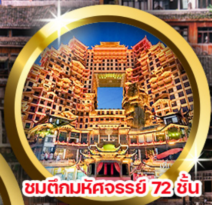
ชมตึกมหัศจรรย์ 72 ชั้น