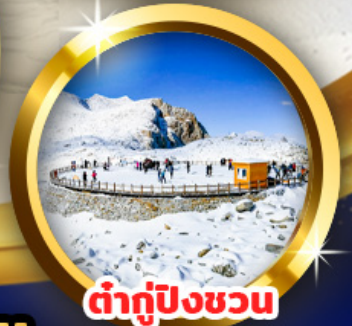
ต้ากู่ปิงชวอน