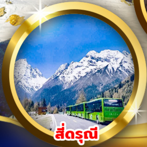
สี่ดรุณี