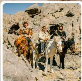
ชนเผ่ามองโกล