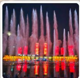
น้ำพุคังปาสือ