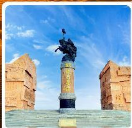
เขตท่องเที่ยวจงกิสข่าน