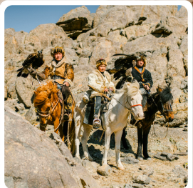
ชนเผ่ามองโกล