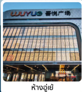
ห้างอู๋ยี่