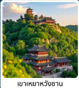
เขาเหย้าหวังซาน