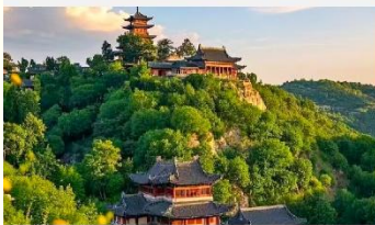
เขาเหยาหวังซาน