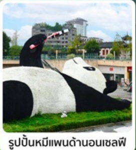
รูปปั้นหมีแพนด้าบนเฉลฟี่