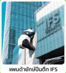
แพนด้ายักษ์ป็นตึก IFS