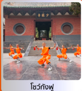
โชว์กังฟู

อาหารมือพิเศษ บุฟเฟ่ต์ สุกี่หม้อไฟ เปิดปักษ์ซืออัน