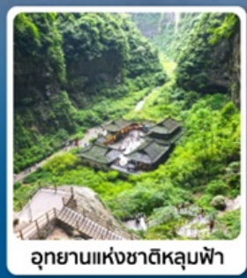
อุทยานแห่งชาติหลุมฟ้า