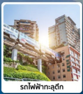
รถไฟฟ้าทะลุถ้ำ