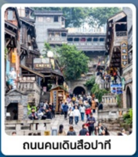
ถนนคนเดินสี่ปาตี

ไอโกล์ ชมไฟยามค่ำคืนของสถาปัตยกรรมจีนโบราณ หงหยาดัง อุทยานเขานางฟ้า ดินแดนแห่ง 4 สิ่งมหัศจรรย์ มรดกโลก 5A