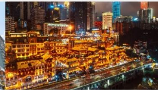
หงหยาดัง(ชมไฟยามค่ำคืน)

*ทางบริษัทฯ ขอสงวนสิทธิ์ในการสลับโปรแกรมทัวร์ตามความเหมาะสมขึ้นอยู่กับสถานการณ์หน้างาน โดยคำนึงถึงผลประโยชน์ของลูกค้าเป็นสำคัญ