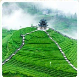
ไร่ชาอูเจียโต