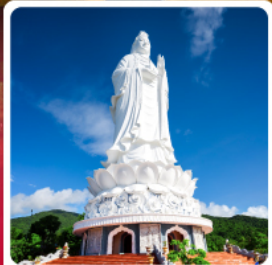
วัดลินฮ้าง