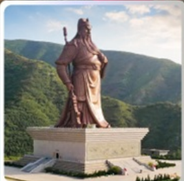
บ้านเกิดท่านกวนอู