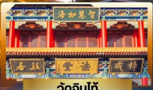
วัดจีนไท้