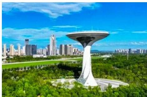
สวนสาธารณะลั่วกั๋ว

เช้า รับประทานอาหารเช้า ณ ห้องอาหารของโรงแรม (8)