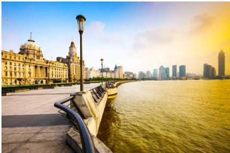
หาดว่อกาน

จากนั้นนำท่านเดินทางโดยรถบัสสู่นครเซี่ยงไฮ้ (ระยะทาง 200 กม. ใช้เวลาเดินทางราว 3 ชั่วโมงเศษ)