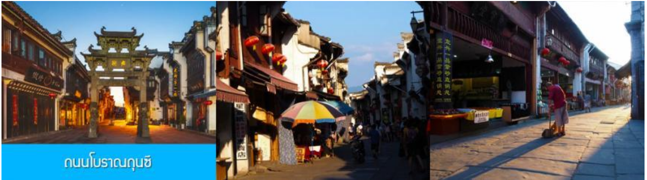
ถนนโบราณฉุนซี