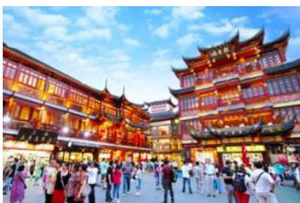
ตลาดร้อยปีฉงหวงเมี่ยว

พักที่ โรงแรม Holiday Inn Express Hotel 4* หรือเทียบเท่าในนครเซี่ยงไฮ้