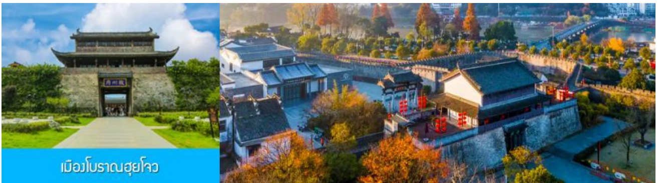
เมืองโบราณซูโจว

จากนั้นนำท่านเดินทางโดยรถบัสสู่ เมืองโบราณซูโจว (ระยะทาง 149 กม. ใช้เวลาเดินทางราว 2 ชั่วโมงเศษ)