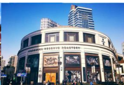
Starbuck Reserve Roastery