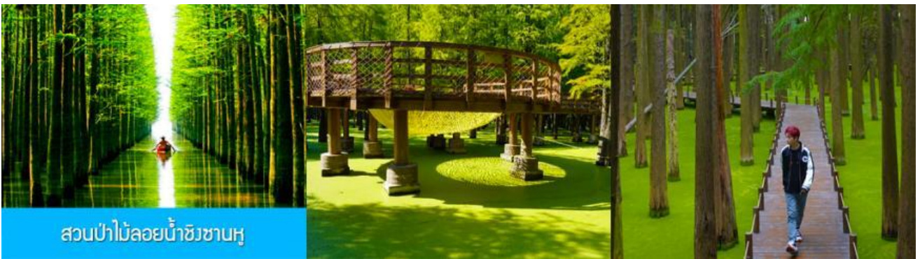
สวนป่าไผ่ลอยน้ำชิงชานหู

พักที่ โรงแรม Holiday Inn Express Hotel 4* หรือเทียบเท่าในนครเซี่ยงไฮ้