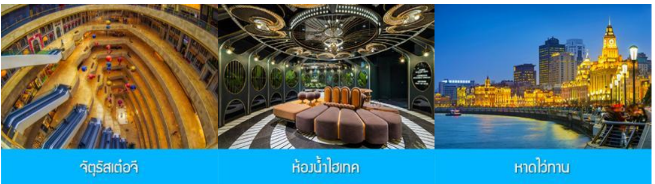
จัตุรัสเต๋อจี

พักที่ โรงแรม Holiday Inn Express Dongshan Hotel 4* หรือเทียบเท่าในนครหนานจิง