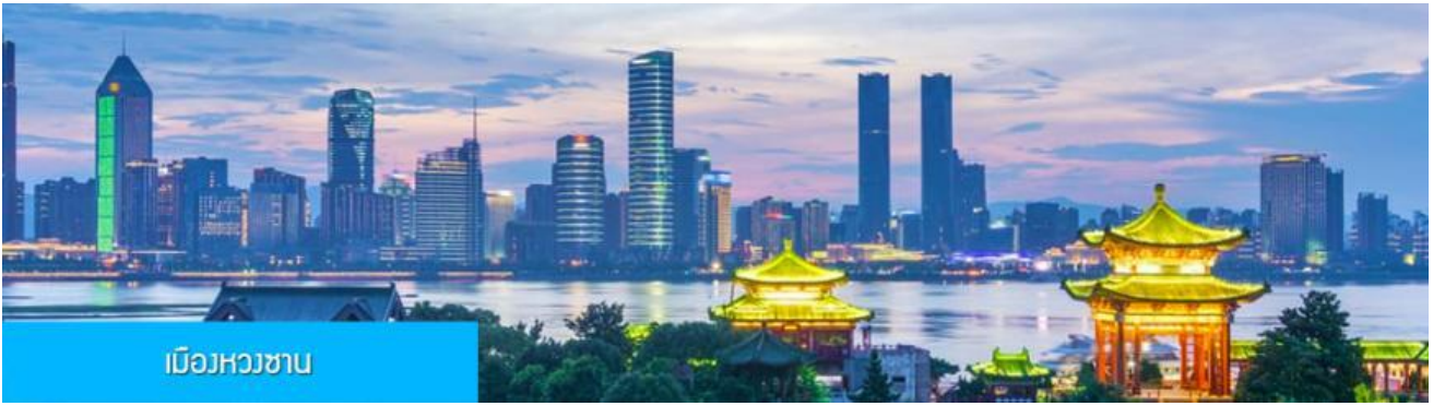
เมืองหวงซาน