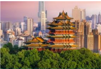
นครนานกิง