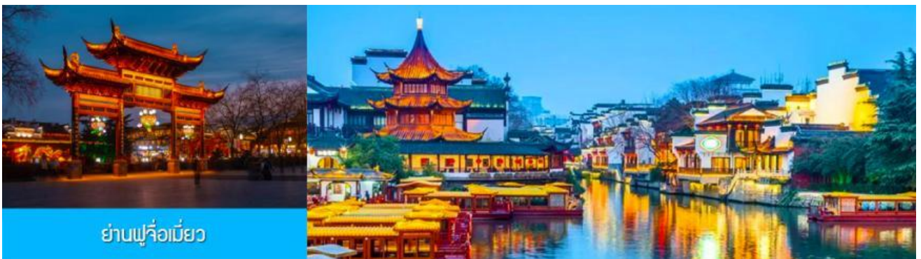
ย่านฟูจื่อเมี่ยว