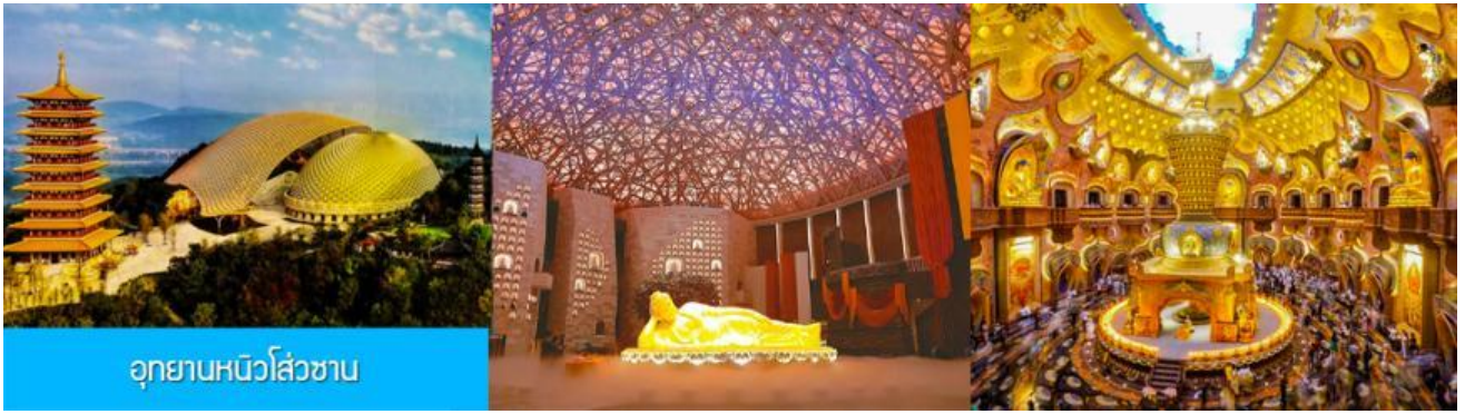
อุทยานหนิวสั่วซาน