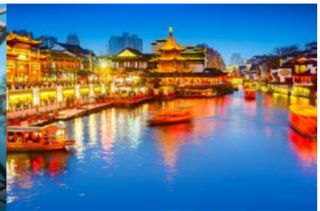
ย่านฟูจื่อเมี่ยว