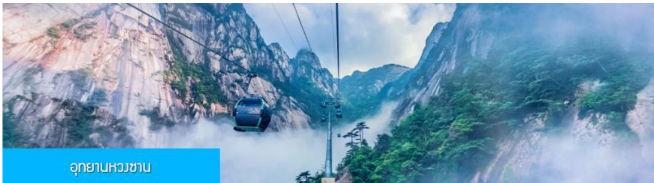
อุทยานหวงซาน