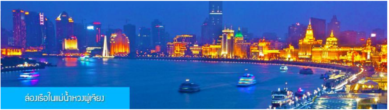
ล่องเรือในแม่น้ำหวงผู่เจียง