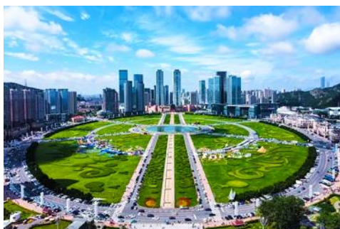
จัตุรัสซิงไห่

เช้า รับประทานอาหารเช้า ณ ห้องอาหารของโรงแรม (1)