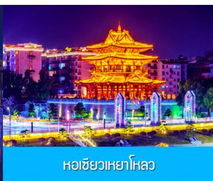
หอชิวเหยาโหลว