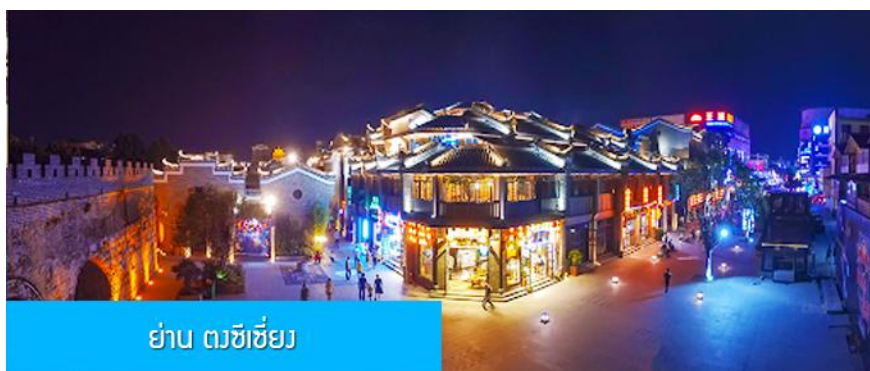
ย่าน ตงซีเซียง

จากนั้นนำท่านเที่ยวชม พิพิธภัณฑ์ดอกกุยฮวา 桂花公社 ดอกกุยฮวาเป็นดอกไม้สีเหลืองที่มีกลิ่นหอม เป็นดอกไม้ประจำเมืองของกุยหลิน จะเบ่งบานในช่วงเดือนมิถุนายน – กรกฎาคมของทุกปี ในช่วงที่ดอกกุยฮวาเบ่งบานในเมืองกุยหลินจะคลุ้งไปด้วยกลิ่นหอมจากดอกกุยฮวา ทั่วเมืองกุยหลินจะเต็มไปด้วยสีเหลืองของดอกกุยฮวา ดอกกุยฮวาสามารถนำมาแปรรูปเป็นอาหารและเครื่องดื่มได้ และได้รับความนิยมจากชาวจีนตอนใต้เป็นอย่างมาก ชมพิพิธภัณฑ์ที่ทันสมัยด้วยระบบจัดแสดงที่ทันสมัย ภายในพิพิธภัณฑ์มีความโอ่อ่า มีการสาธิตและจำหน่ายผลิตภัณฑ์ที่ทำจากดอกกุยฮวา อาทิ ขนมดอกกุยฮวา ชาที่ทำจากดอกกุยฮวา และสินค้าพื้นเมืองอื่น ๆ