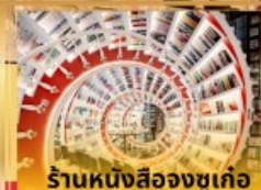
ร้านหนังสือจุงเก้อ