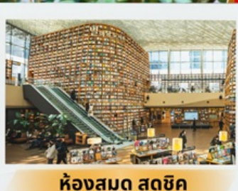
ห้องสมุด สุดชิค