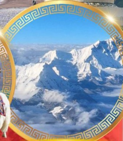
ห้าสุดยอดแห่งหิมาลิย