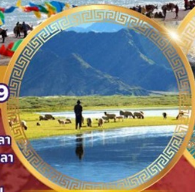
ทุ่งหญ้าทิเบตเหนือ ซางเปย์

ลานา พระราชวังโปตาลา วัดโจคัง ถนนแปดเหลี่ยม จุดชมวิวย่อเซกัมบาลา ธารน้ำแข็งคาโรลา ชิคาเซ่ ช่องเขาจาชัวลา ถนน 108 โค้ง เอเวอเรสต์เบสแคมป์ วัดทาชิลูโบ ทิวทัศน์แม่น้ำหยาลูจางปู ทุ่งหญ้าทิเบตเหนือ ช่องเขานาเคนลา ทะเลสาบนาปูซิว