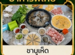
ชาปูเห็ด