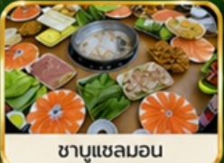
ชาปูแชลมอน