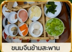
ขนมจีนข้ามสะพาน