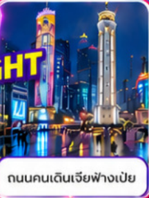
ถนนคนเดินเจียฟางเปี่ย