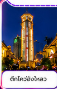
ตึกโควอชิงไหลว