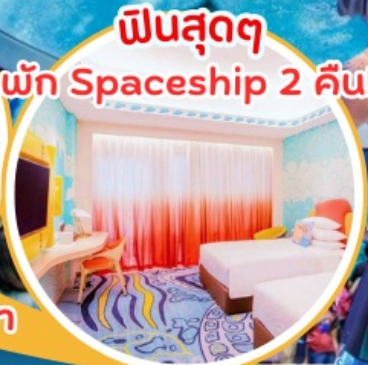
ฟินสุดๆ พัก Spaceship 2 คืน!!