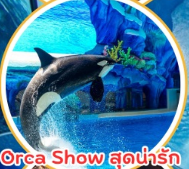
Orca Show สุดน่ารัก