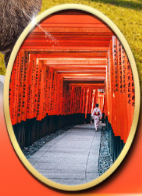
Fushimi Inari Shrine

รหัสทัวร์ RJ-XJ139 เดินทาง 5D 3N ท.ย. - ต.ค. 2569