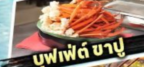
บุฟเฟต์ ซาซุ