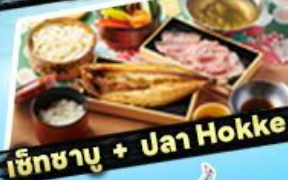
เซ็ทซาซุ + ปลา Hokke

ราคาเริ่มต้น 36,919 บาท รวมภาษีมูลค่าเพิ่ม 7%