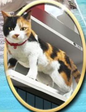
ซึโอบิง ชินจุกุ