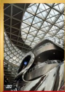
พิพิธภัณฑ์ศิลปะร่วมสมัยเซินเจิ้น

ชมสถาปัตยกรรมระดับโลก พิพิธภัณฑ์ศิลปะร่วมสมัยเซินเจิ้น (MOCAPE) และ Shenzhen Civic Center