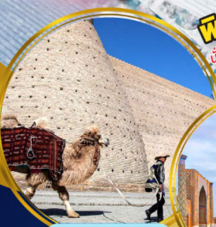
บ่อมปราทาร์บุคาร่า