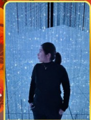
ที่มอลล์โตเกียว