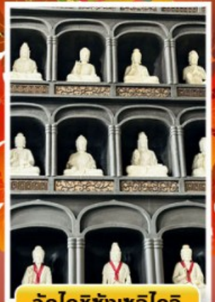
วัดไดชิซังเซโด้จิ