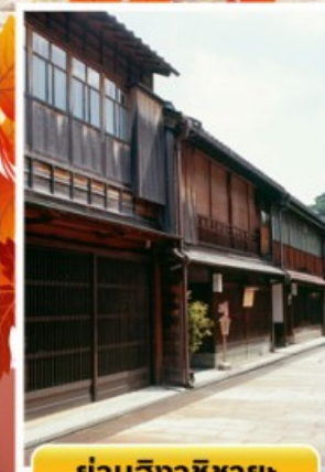
ย่านอิงาชิบายะ