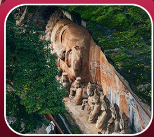
“ผาหินแกะสลักต้าจู้”