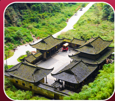
“อุทยานหลุมฟ้า”