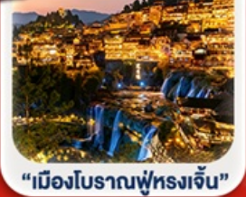
“เมืองโบราณฟู่หลงเจิน”