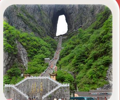
“กำประตูลิ่ว”