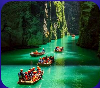
“ ผิงซานแกรนด์แคนยอน ”

เที่ยวจีน 2 มณฑล เสฉวน+หูเป่ย์ • ถ้าเถิงหลง • หุบเขาสิงโต ซื่อจื่อกวน ล่องเรือมังกรกังส่วยชมวิวยามค่ำคืน • ผิงซานแกรนด์แคนยอน (รวมล่องเรือ) หงหยาดัง • จุดชมรถไฟฟ้าทะลุคอก • ตึกตะเกียบ • สือปาที • หลงเหมินฮ่าว